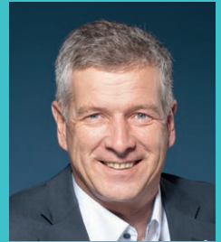
Thomas de Courten Nationalrat Mitglied der SGK des Nationalrates