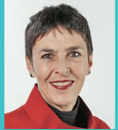
Barbara Gysi Mitglied der SGK des Nationalrates SP-Fraktion