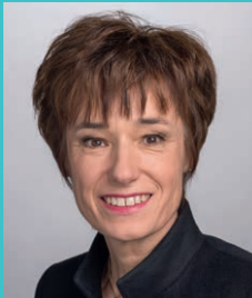
Ruth Humbel Vize-Präsidentin der SGK des Nationalrates CVP-Fraktion