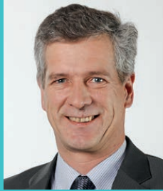
Thomas de Courten Präsident der SGK des Nationalrates SVP-Fraktion